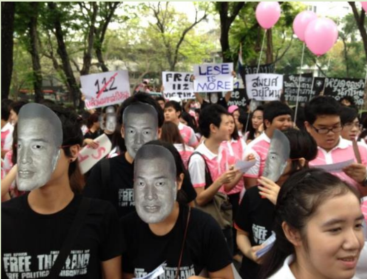
การรณรงค์หน้ากากสมยศ

กลุ่มกิจกรรมดังกล่าวได้แจกแถลงการณ์และปราศรัยเกี่ยวกับเสรีภาพในการแสดงออก และเรียกร้องให้คนรุ่นใหม่เข้าร่วมกันรณรงค์การปล่อยนักโทษการเมือง