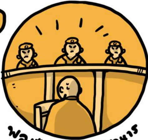
พลเรือนจำต่างหาก