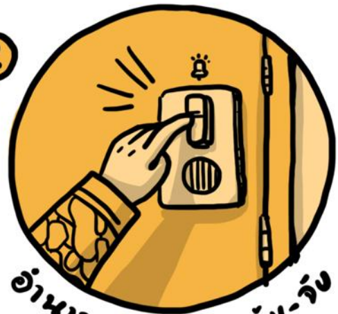
อำนาจพิเศษ บุค-ดัน-จับ

คำสั่งหัวหน้า คสช. ฉบับที่ 3/2558 ให้อำนาจทหารปราบปรามคดีการเมือง คำสั่งหัวหน้า คสช. ฉบับที่ 13/2559 ให้อำนาจทหารปราบปรามผู้มีอิทธิพล คำสั่งหัวหน้า คสช. ฉบับที่ 5/2560 ให้อำนาจประกาศพื้นที่ควบคุม บุควัดพระธรรมกาย